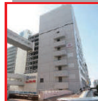
TKP大宮駅西口 カンファレンスセンター

『本セミナーはオーナー様向けセミナーとなっております。オーナー様お誘い合わせのうえ、ご参加下さいます様お願い致します。』