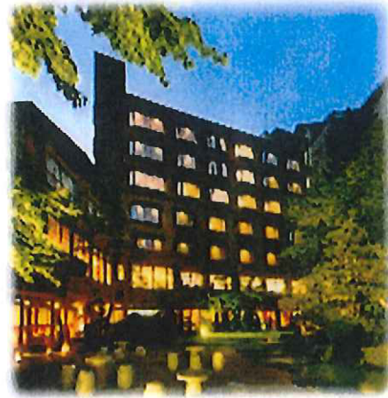
ほほえみの宿 山形県天童温泉 滝の湯 TAKINOYU HOTEL