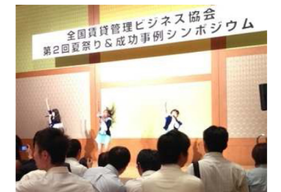
※写真は昨年開催時のものです