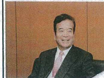
全管協・会長 ご挨拶