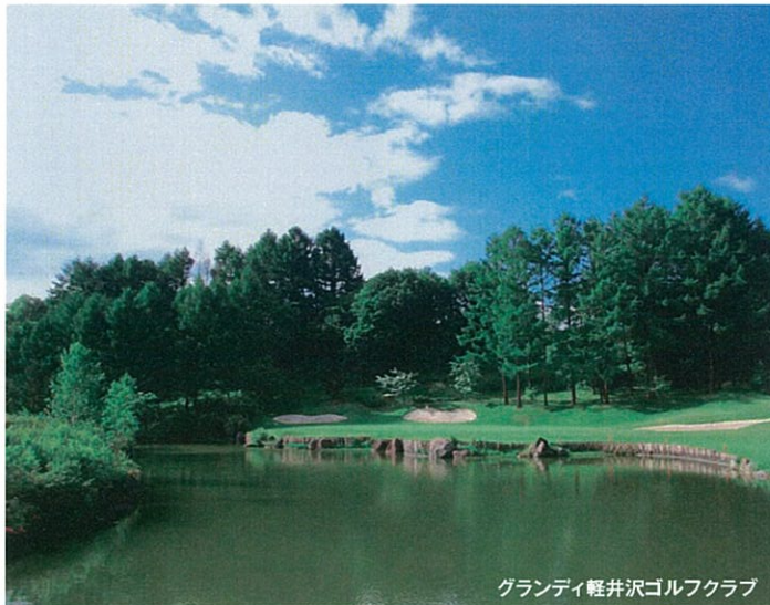
グランディ軽井沢ゴルフクラブ

歴史と格式のある日本を代表するリゾート地、軽井沢。 この地に息づく豊かな自然が、ゴルファーに新たな感動をお届けします。 ロケーションもクオリティも最上級のゴルフコース、グランディ軽井沢ゴルフクラブ。 美しい景色とともに、すべてのショットが記憶に深く刻まれていきます。