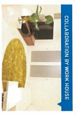
COLLABORATION BY WORK HOUSE