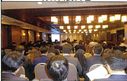
講師: 上野 典行 所長