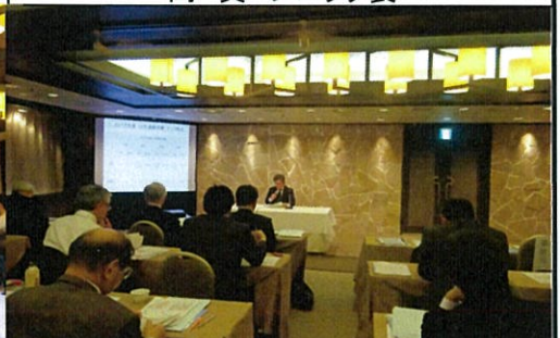
SSIホールディングス 後藤 大司社長